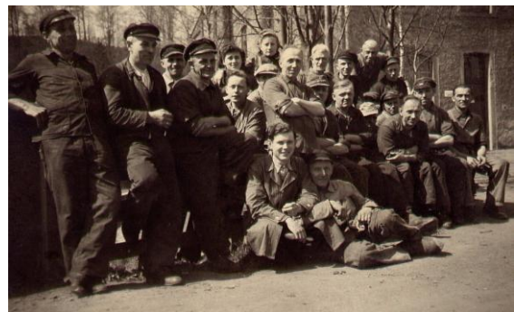
Mittagspause im Betrieb – fast familiär

Im Unternehmen geht es vorwärts . Zu den ersten Großkunden gehört die SDAG Wismut , Wattleanzüge für die Kumpel werden gebraucht .